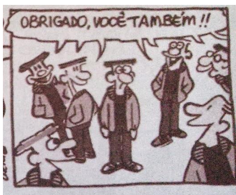
FIGURA 5: Balão uníssono.