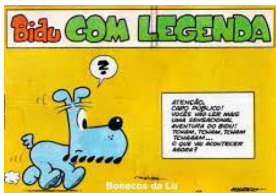
FIGURA 7: Legenda.