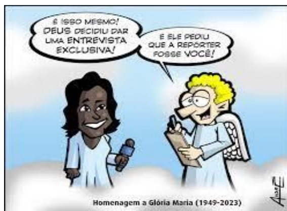
FIGURA 15: Charge em homenagem à repórter Glória Maria.

FONTE: https://www.jornaldenovaodessa.com.br/charges/charge-homenagem/ .