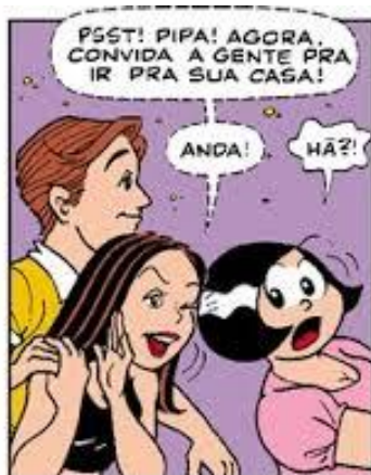
FIGURA 4: Cochicho.