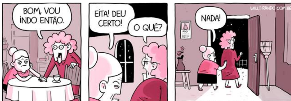
FIGURA 10: Tirinha D. Anésia com visita.