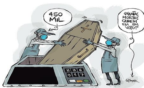
FIGURA 12: Brasil em charge.