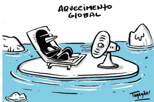
FIGURA 13: Charge Aquecimento Global.