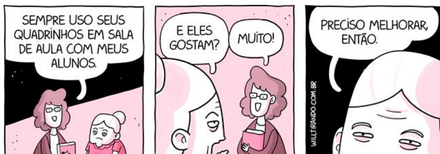
FIGURA 9: Tirinha D. Anésia homenagem aos professores.