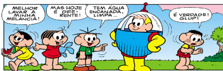
FIGURA 3: Balão de fala.