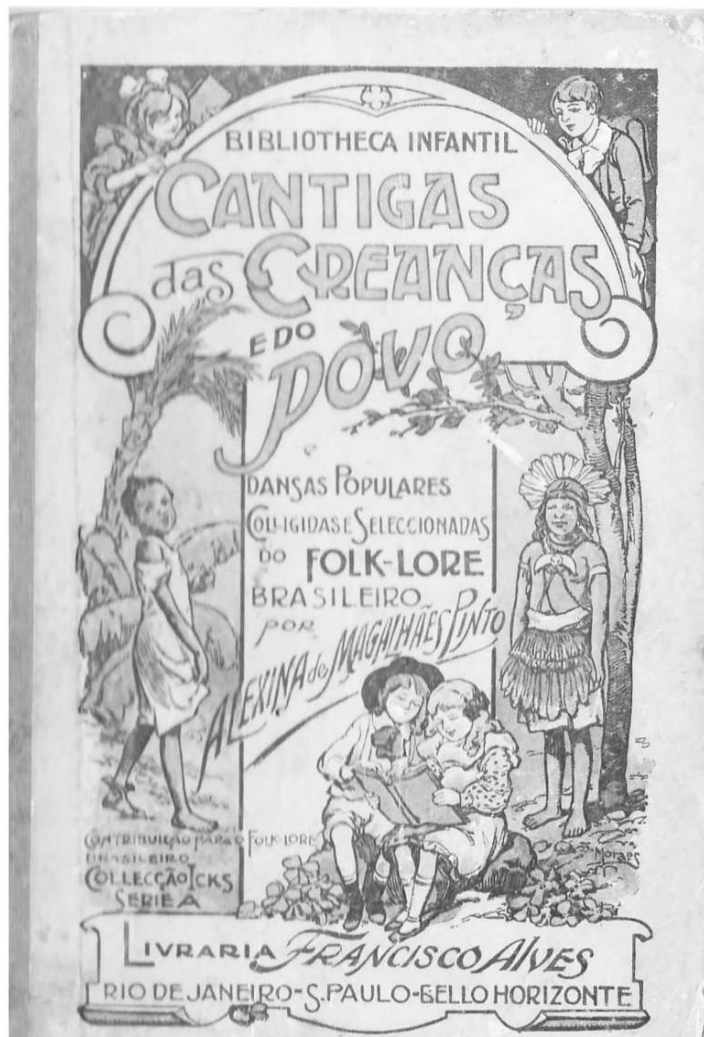
Capa da versão do livro Cantigas das crianças e do povo e danças populares , de Alexina de Magalhães Pinto, publicada em 1916.