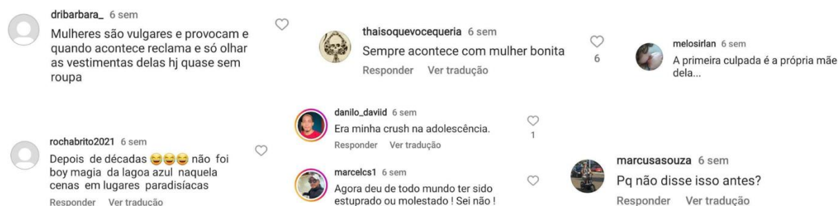
Figura 2: Comentários sobre o caso Brooke Shields no post da Folha.