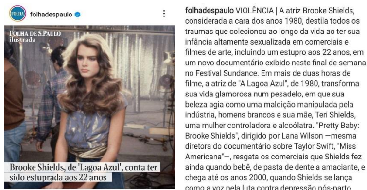
Figura 1: Notícia com declaração de Brook Shields sobre estupro aos 22 anos.