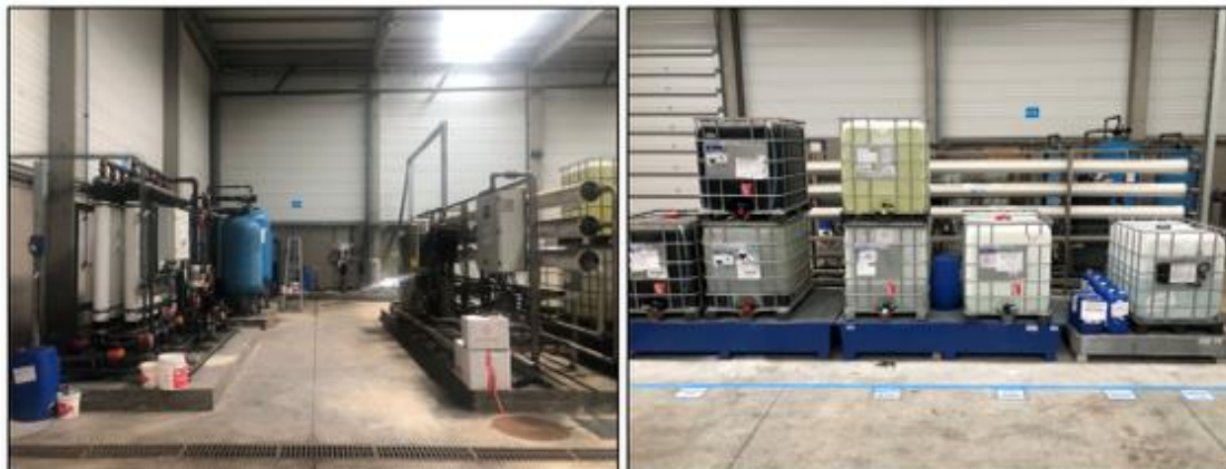
Figura 1 – Estação de Tratamento de Águas (ETA)

Para a Gyptec é de extrema importância que seja feita uma boa gestão da ETA e de todas as atividades nela decorrentes, visto ser um ativo com bastante influência no processo produtivo. Com a falta de registos das operações realizadas na ETA e dos consumíveis utilizados no seu funcionamento, torna-se difícil fazer uma boa gestão do ativo, uma vez que o controlo, tanto das operações como dos consumíveis utilizados, é fundamental. Com a monitorização do processo da ETA e da otimização da sua gestão, é possível melhorar o aproveitamento dos recursos utilizados, reduzir desperdícios e, principalmente, gerar oportunidades de minimização de custos.